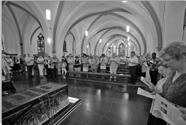
Besuchergruppe beim Gebet in der Unterkirche von Steyl