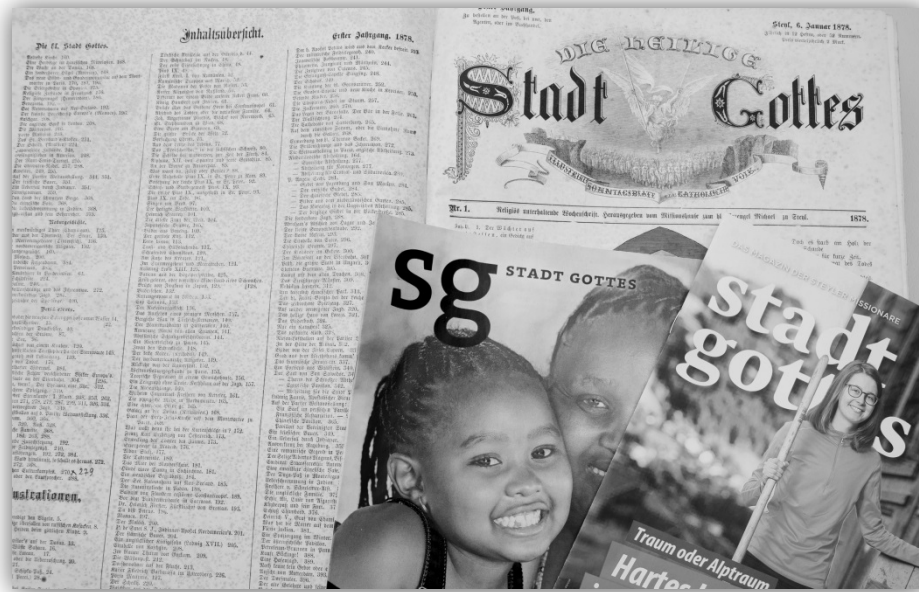
Die erste Ausgabe der Stadt Gottes und heutige Exemplare

laren. Die Zeitschrift konnte in der Nachkriegszeit ihre Auflage auf 1 125 000 im Jahr 1963 steigern.